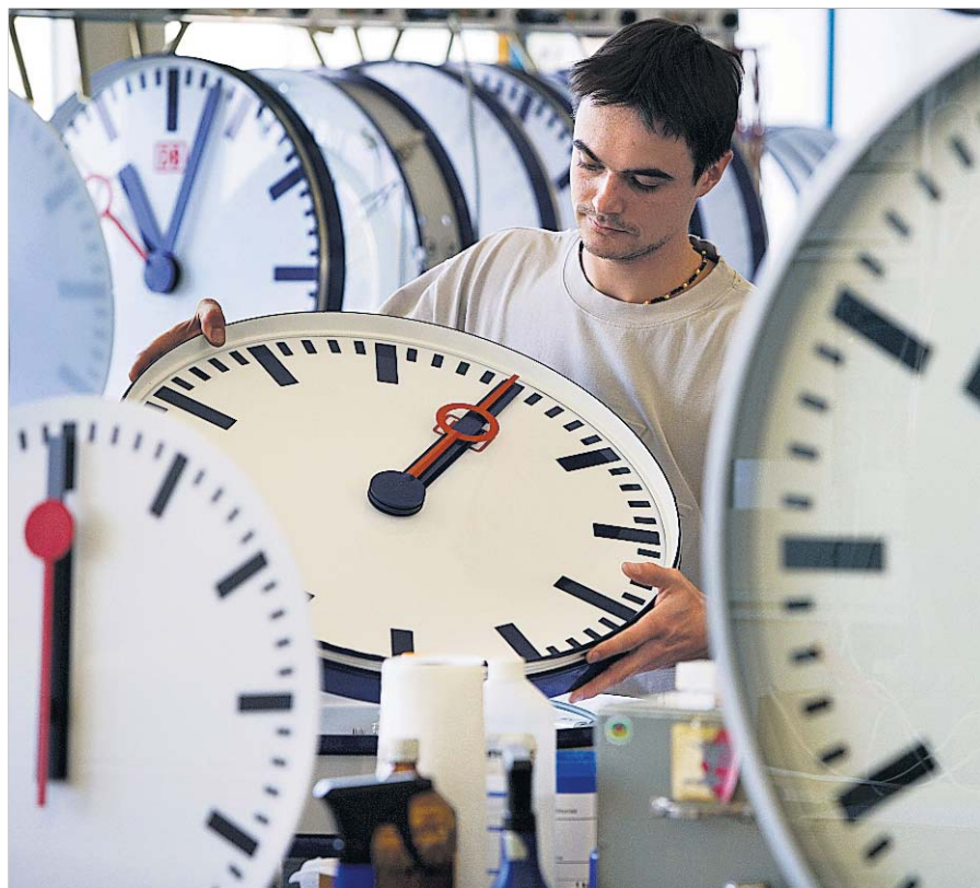
UHRENPRODUKTION Nachfrage nach Temporärangestellten ist wieder gross.

Auf die Trendumkehr am Arbeitsmarkt reagiert Stellenvermittler Manpower, indem er die Vermittlung von Spezialisten weiter ausbaut. Dabei sind nicht mehr nur die «klassischen Temporärbranchen» wie die Uhrenindustrie und der Bau auf dem Radar. Schüpbach: «Im Gesundheitswesen, gerade in der Pflege, wird die Temporär-Rekrutierung immer bedeutender.» Doch auch der Anästhesist sei zunehmend bereit, nur zeitweise angestellt zu sein, zumal sich das Image der Temporärarbeit stark verändert habe (vgl. Interview).